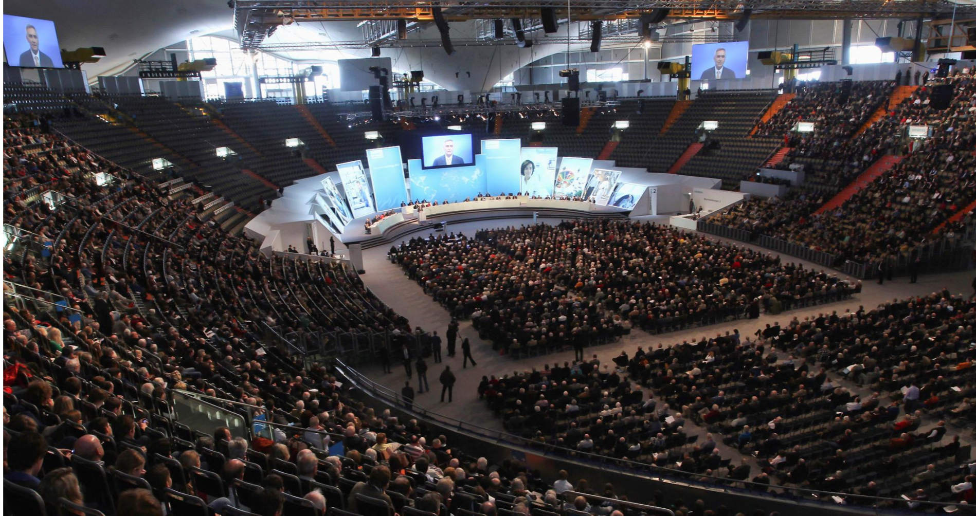
Siemens, Hauptversammlung 2012 (Olympiahalle, München): Präsenz 38,4%